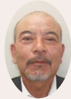
大阪建設国民健康保険組合